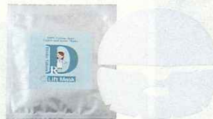
ジュランツ リファイン リフトマスク 6枚入り 9,975円/Dr.高須英津子コスメ コラーゲンや ヒアルロン酸がたっぷり。セパレートタイプ。

美肌とシャープなフェイスラインが一度に 叶う上下セパレートタイプのマスクにソッ コン♥ 引き上げながら装着すると、エ ステ級に顔がキュッと引き締まるよ。