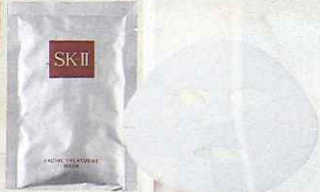
SK-II フェイシャルトリートメントマスク 6枚入り 9,975円(編集部調べ)/マックスファクター

ピテラが肌をうるおしてくれるリッチなシート マスクは、大切な仕事の前夜に必ず投入。 肌がゆらいだときに毎日使って一気にコンディ ションを取り戻す特効薬としても活用しています。