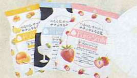
(右から)ピュアスマイル エッセ ンスマスク ヨーグルトシリーズ ストロベリー、同 プレーン、同 ミック スフルーツ 各105円/サンスマイル

最近、ビタミンAやビタミンB2を含んだヨー グルトの美肌効果に注目♥ ヨーグルト成分 を配合したパックを愛用しているよ。いくつ かあるフレーバーを気分によって使い分け。