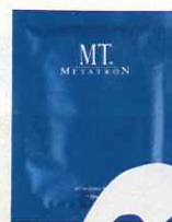
MT アクティブイ ト・マスク 6枚入 り 11,340円/MT コスメティクス マイクロファイバ ーシートが肌にピ タッと密着。

Point 首〜デコルテを手でなぞってし っかり密着。パック中にはキ ャールのボディクリームを塗るよ。