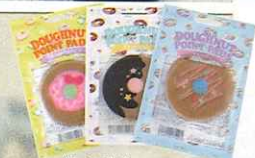
(右から)ピュアスマイル スウィートドーナツポイ ントパッド バニラ、同 シ ョコラ、同ストロベリー 各10シート入り 各105円 /サンスマイル