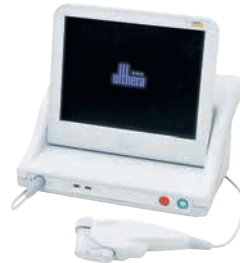
「ウルセラ」(写真右)と「サーマクールCPT」(写真左)の組み合わせでフェイスラインのゆるみにカツ！